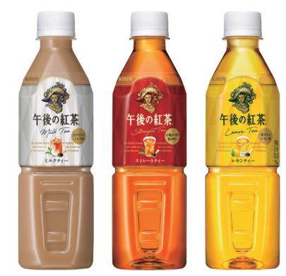
500ml PET 〈自動販売機用〉